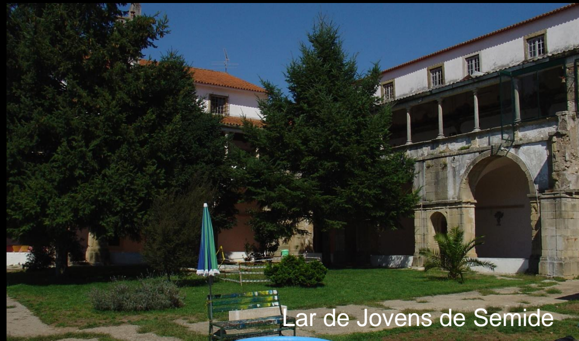
Lar de Jovens de Semide

“Miranda do Corvo: uma comunidade saudável e solidária