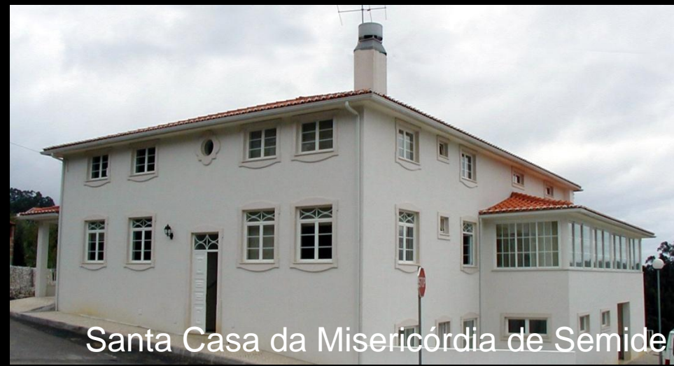
Santa Casa da Misericórdia de Semide

“Miranda do Corvo uma comunidade saudável e solidária”