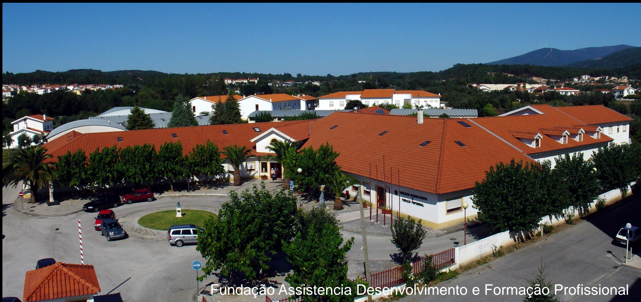
Fundação Assistência Desenvolvimento e Formação Profissional

“Miranda do Corvo: uma comunidade saudável e solidária