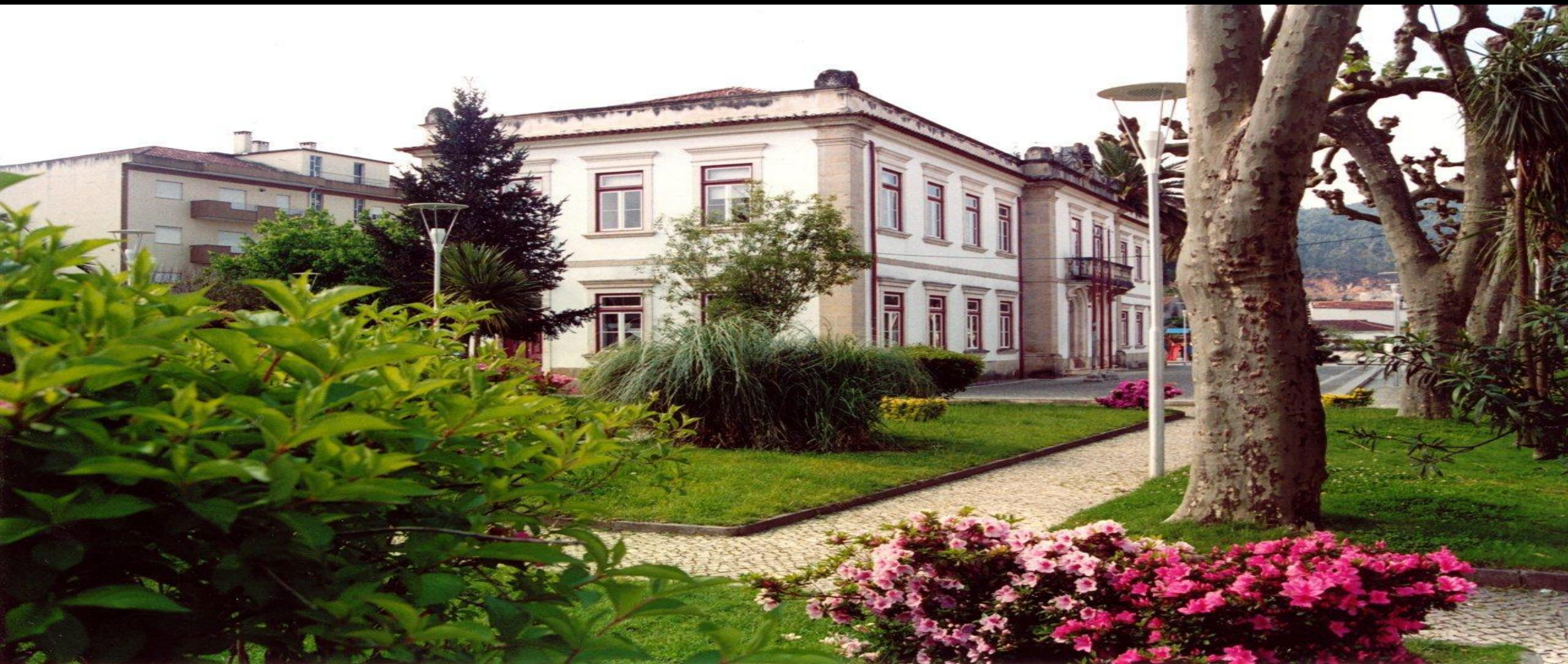
Miranda do Corvo, uma terra solidária e de tradições