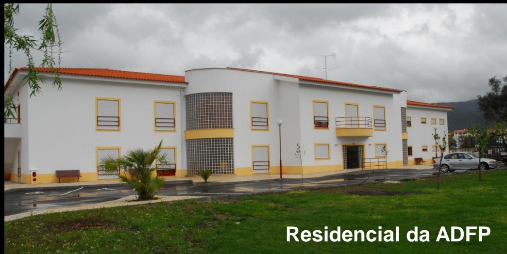
Residencial da ADFP