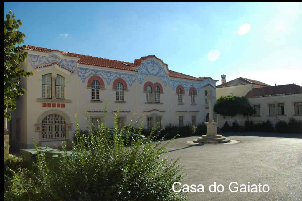
Casa do Gaiato