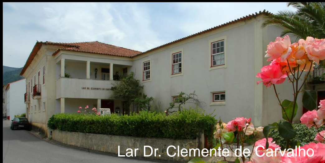
Lar Dr. Clemente de Carvalho