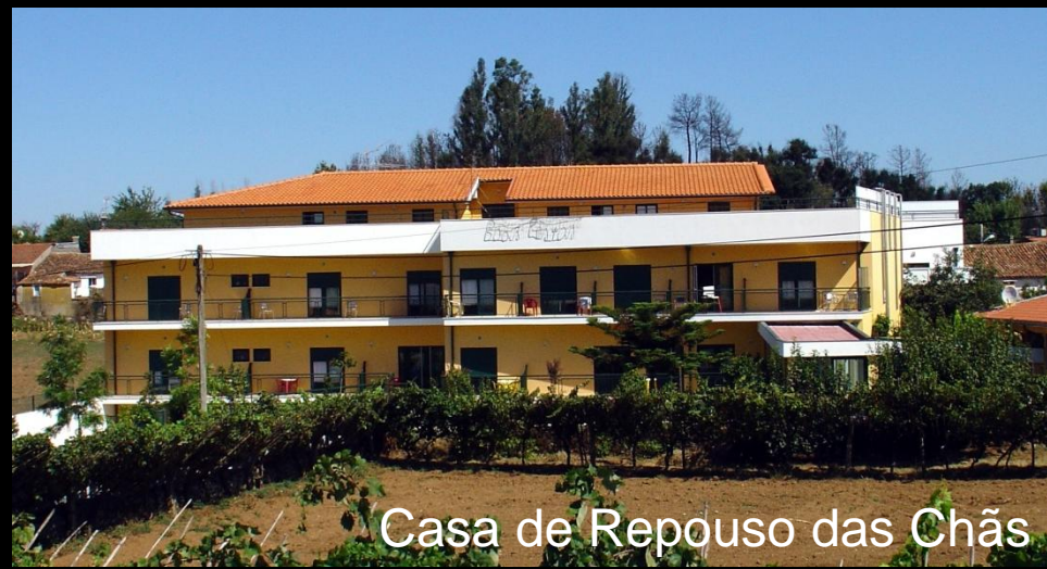
Casa de Repouso das Chãs